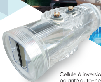
Cellule à inversion de polarité auto-nettoyante