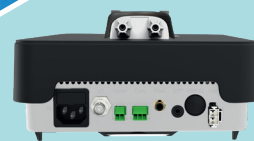
Raccordement « Plug & Play »