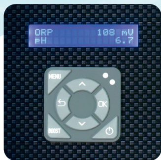
Écran LCD et pavé tactile